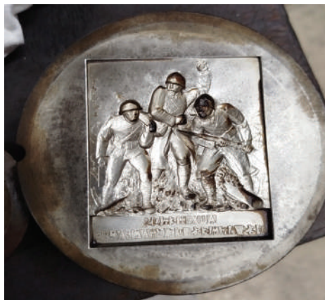
Moule ou outil retrouvé chez Arthus Bertrand - activité désormais reprise par la société Drago

En explorant les archives du sculpteur Real del Sarte, nous avons retrouvé un contrat de 1923 entre le sculpteur et le fabricant de médailles Arthus Bertrand. Cette société ayant été sollicitée, a rapidement répondu et retrouvé les «outils» permettant de rééditer la plaque - en photo. L'ASMAC va rééditer cette plaque, à titre exceptionnel, et en quantité limitée, pour la proposer aux participants du colloque des 4 et 5 juin à Reims - voir www.asmac.fr ainsi qu'aux adhérents de l'ASMAC ou à leurs familles.