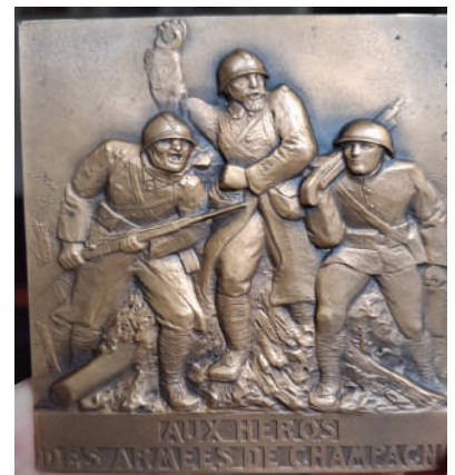
Edition 1924 de la plaque au format 60x70cm

Le prix de vente de cette plaque sera de 50 euros + frais de port.